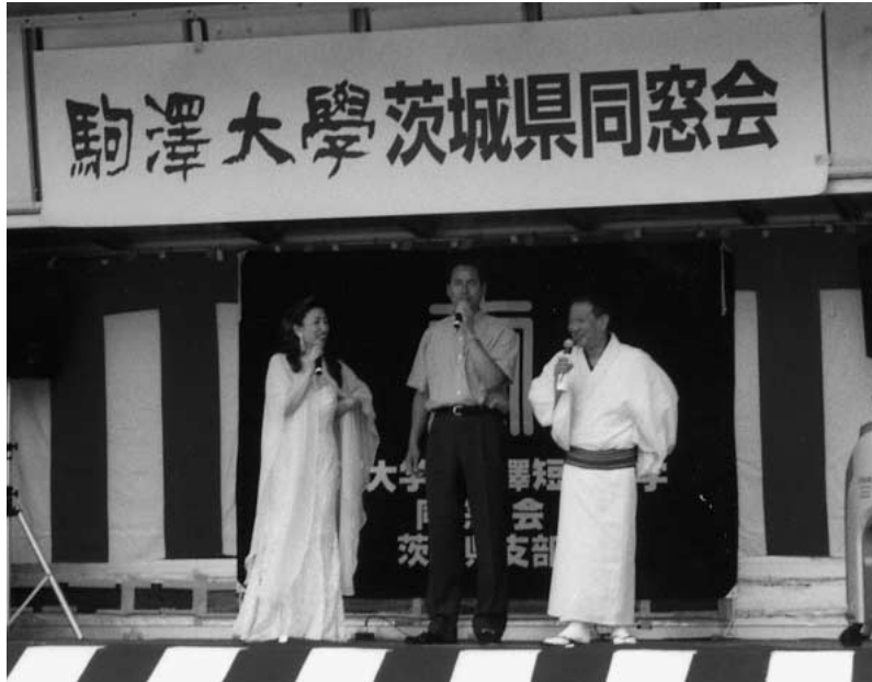
タレント3人揃い踏み