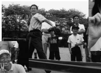
ストラックアウトに向かって 全力投球