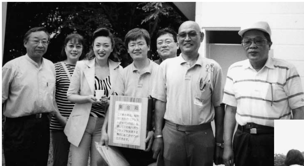
お疲れ様!陰の立て役者達