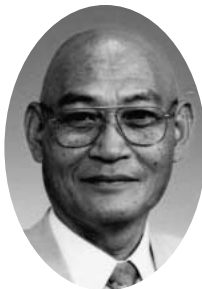
美野里町 昭和四一年 仏教卒