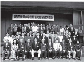
第6回駒澤大学茨城県同窓会総会報告

平成19年10月27日(土)二年に一度の総会が県央地区、水戸市の茨城県J A会館をお借りして開催することが出来ました。水戸市では、前回平成11年以来的の2回目の開催となりました。駒澤大学同窓会本部を代表し